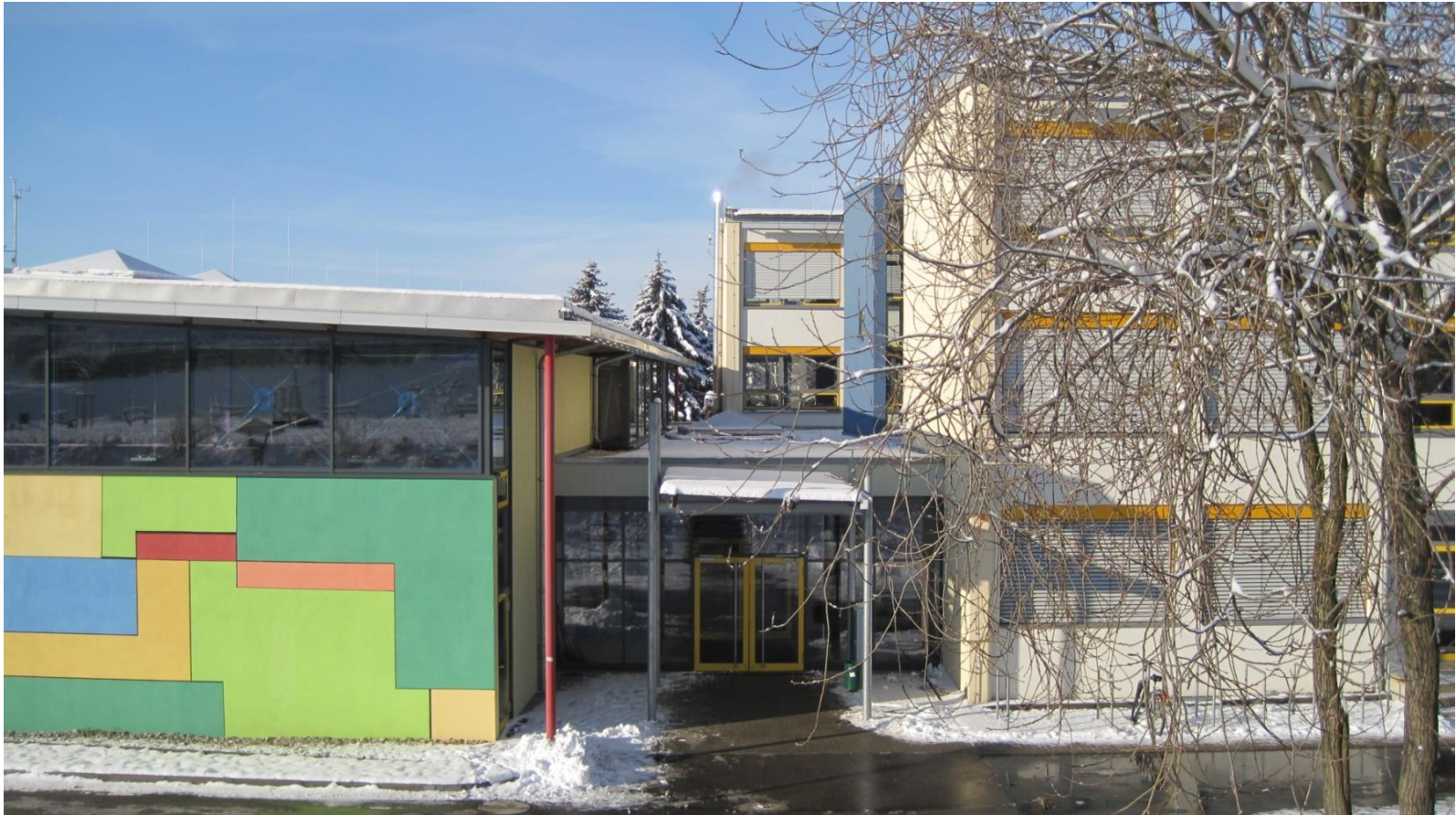
„Glückauf“- Gymnasium Dippoldiswalde/Altenberg